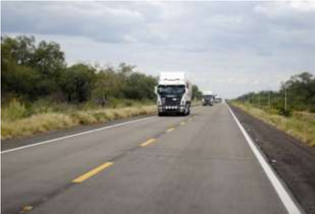
Vehículos paraguayos circulando hacia Ibibobo, luego de sortear el infierno que representa transitar en el tramo de La Patria, en nuestra ruta.

Rubén Vaca Salazar, ejecutivo regional de Villa Montes, confirmó que Evo Morales ordenó concluir dentro de este año la pavimentación de la ruta que llega hasta Infante Rivarola, en la frontera con Paraguay. El Mandatario boliviano estuvo en Villa Montes en abril pasado y realizó un sobrevuelo en helicóptero para observar el trazado de la ruta. Al finalizar la inspección ocular, Evo Morales ordenó concluir dentro de este año las obras; queda un trecho de 18 kilómetros sin asfaltar de un total de 120 kilómetros. Para que la tarea pueda continuar, el Poder Ejecutivo de Bolivia promulgó un decreto que permite un llamado a licitación en el trecho de 18 kilómetros faltantes. “Evo Morales, apenas llegó a La Paz, ya preparó el decreto y ahora se ven detalles de la licitación para lograr la meta de terminar antes de fin de año”, explicó Rubén Vaca Salazar (Ver más) .